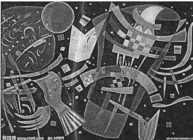
图二：20 世纪初期抽象派的创始人康定斯基的作品之一

1、上面有两幅图像，图一是欧洲发现的约三万年前的原始人描绘的洞穴壁画，图二是 20 世纪初抽象派的创始人康定斯基的绘画作品。请根据图像来回答如下几个问题：（50 分）